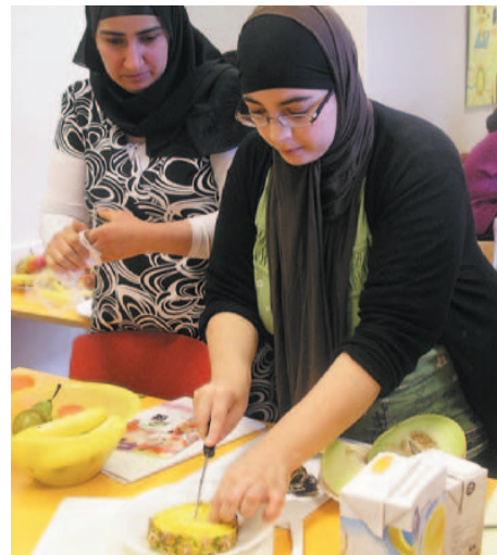
Meedoen aan de quiz 'Gezond en duurzaam eten'